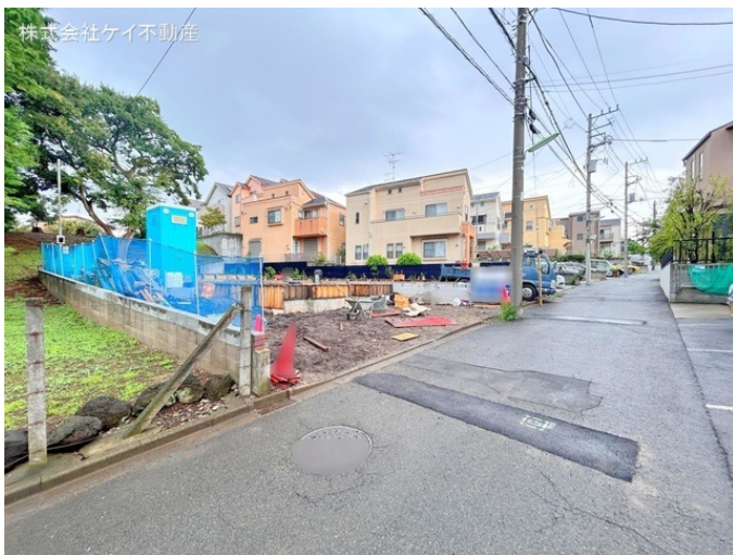
株式会社ケイ不動産