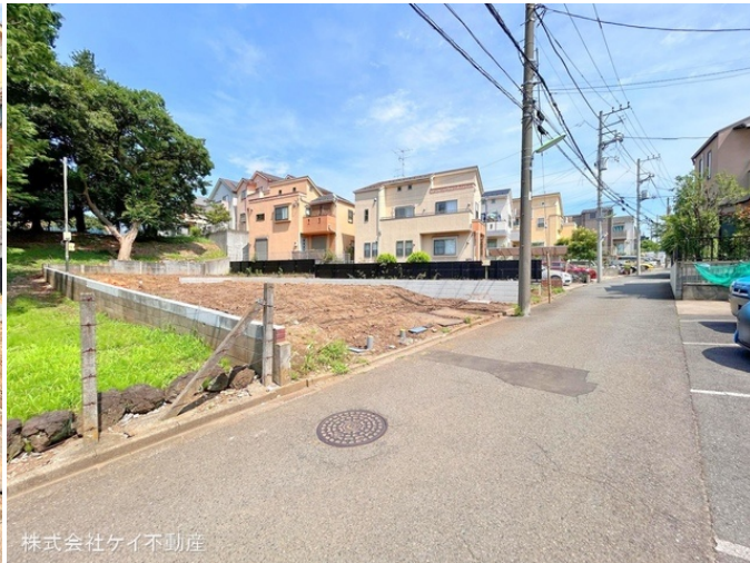
株式会社ケイ不動産