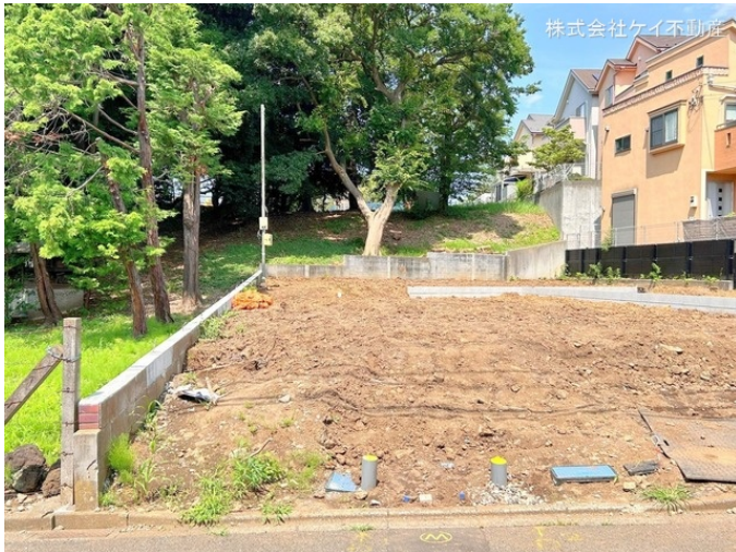
株式会社ケイ不動産