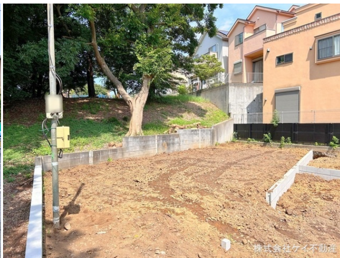
株式会社ケイ不動産