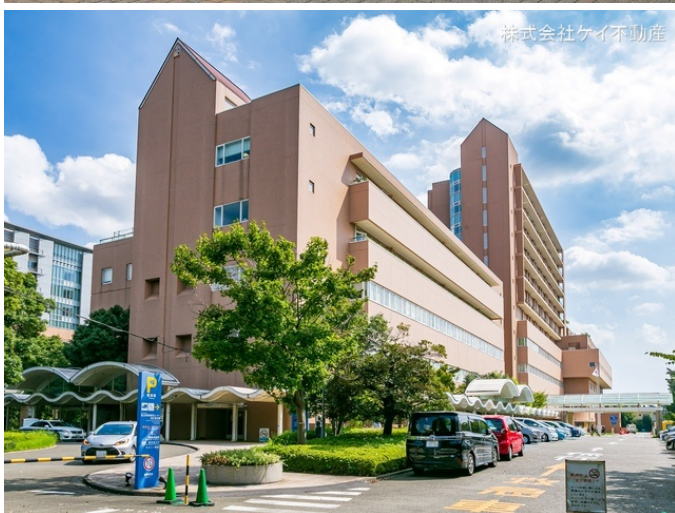
株式会社ケイ不動産