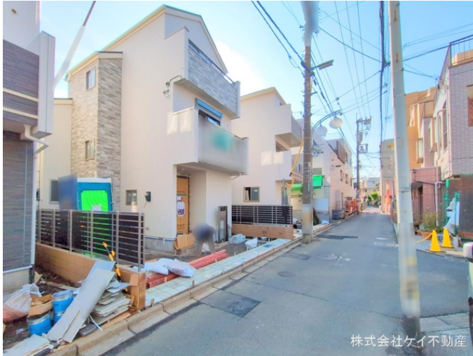
株式会社ケイ不動産