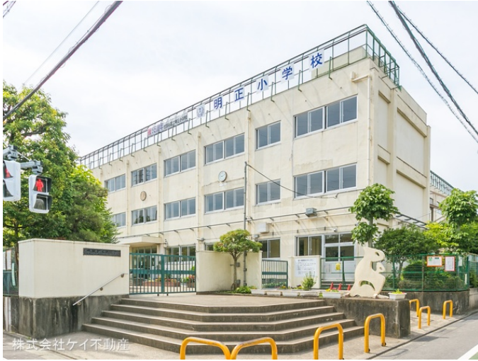
株式会社ケイ不動産