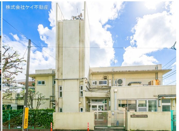
株式会社ケイ不動産