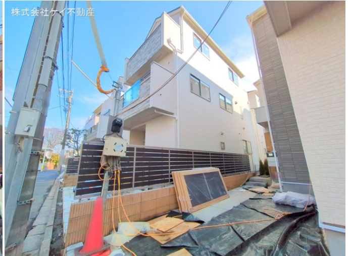
株式会社ケイ不動産