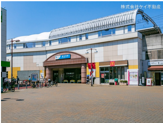
株式会社ケイ不動産