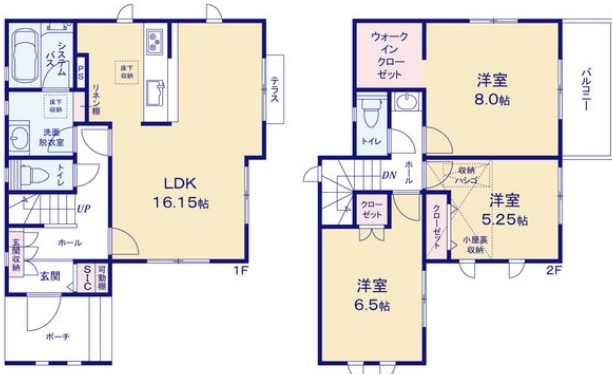
※SIC:シューズインクローゼット