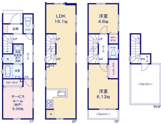
株式会社ケイ不動産